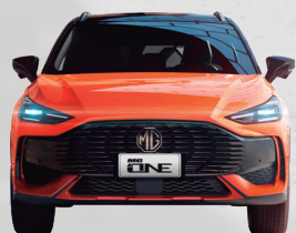
Ancho total 1,871 mm mm