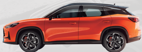
Largo total 4,581 mm